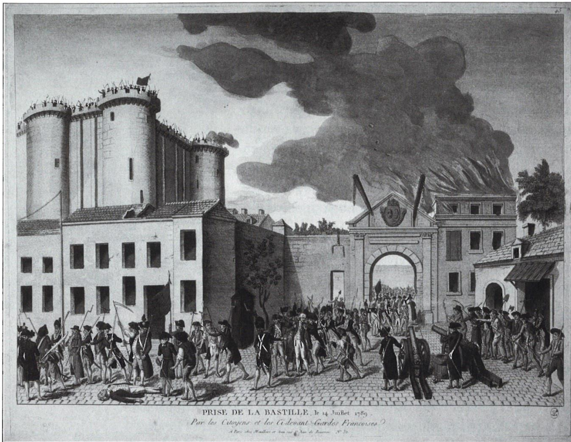
Stormandet av Bastiljen den 14 juli 1789 ses ofta som startskottet för den franska revolutionen.