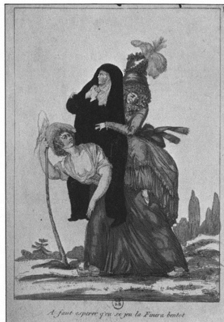
En satirteckning över det franska ståndssamhället. Vilka tre stånd finns representerade och vad säger teckningen om relationen mellan dem?

Snart spred sig oroligheterna i städerna till landsbygden. Bönder som plågades av skattetrycket och hungern tog till vapen och stormade adelns gods. De brände de arkiv där deras skatter och skyldigheter fanns antecknade. Den nya folkförsamlingen avskaffade i augusti de adliga privilegierna och tiondet till kyrkan. Samma månad antog nationalförsamlingen deklarationen om de mänskliga rättigheterna. I första paragrafen stod det att läsa: "Människor föds och förblir fria och med lika rättigheter..."