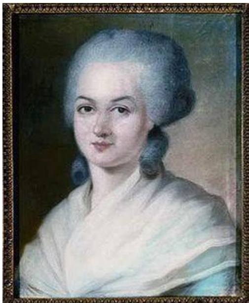
Olympe de Gouges